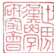
World Association of Chinese Studies e.V. phone +49 2302 926-866, fax -813 July 28, 2018